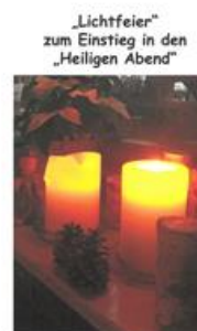
„Lichtfeier“ zum Einstieg in den „Heiligen Abend“ Dienstag 24.12.24 um 7.00 Uhr in der Pfarrkirche St. Germanus