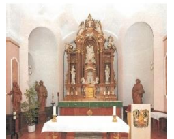
MUSIK IN DER KAPELLE